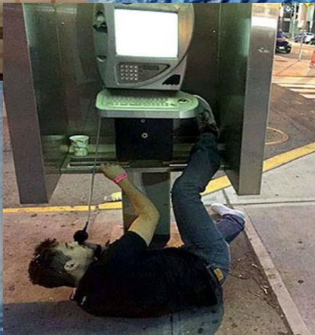
Что то пошло не так