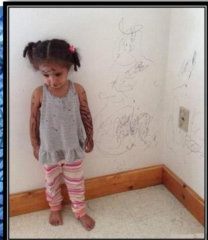
Художника, может обидеть каждый!!!