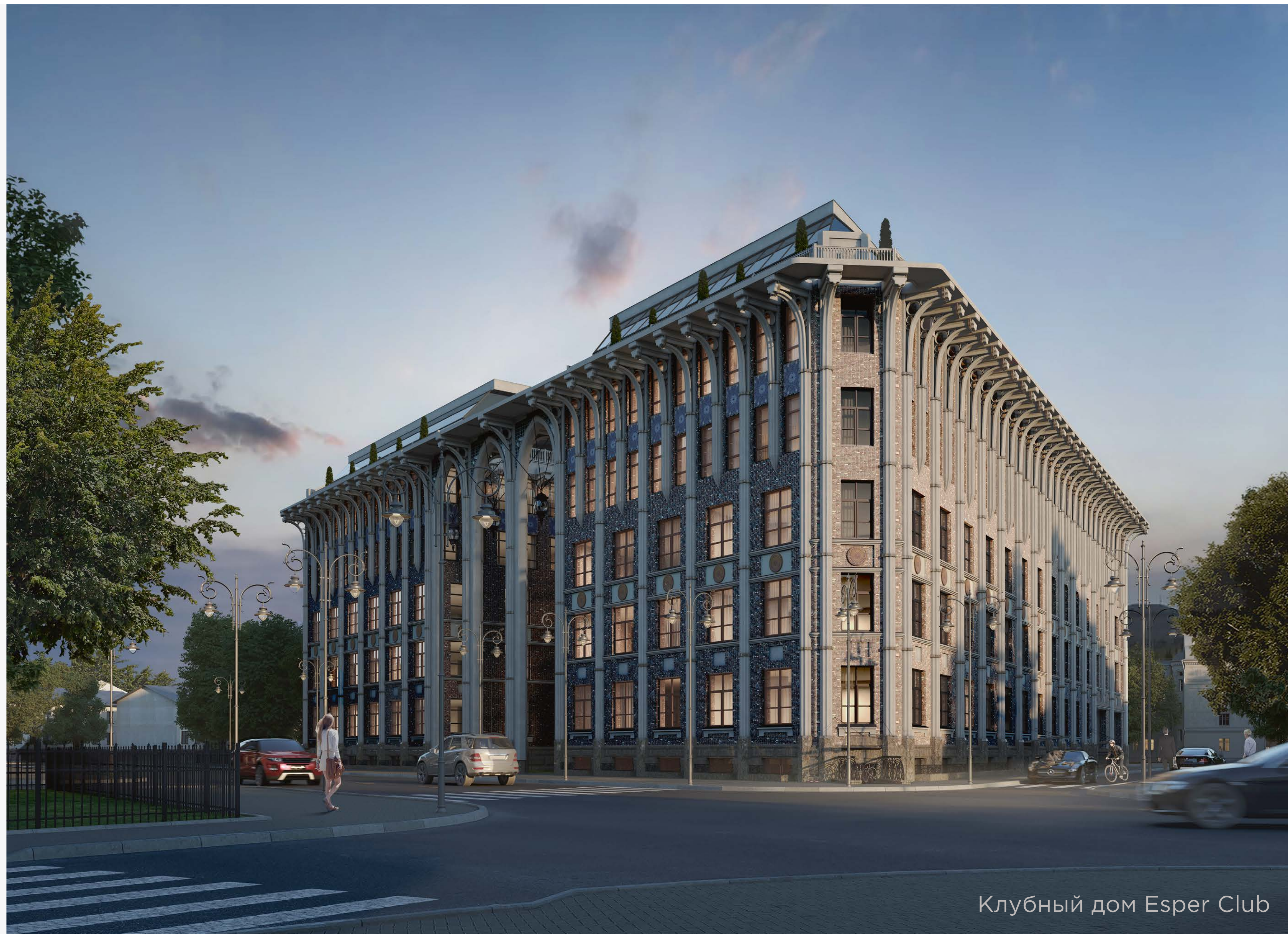
Клубный дом Esper Club