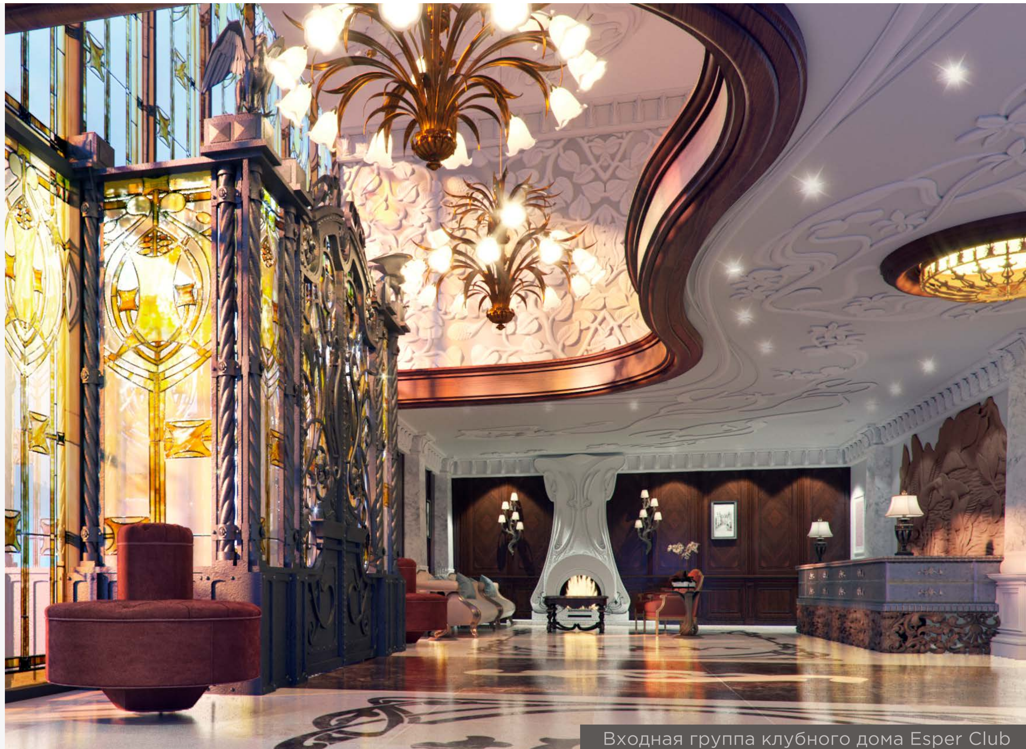
Входная группа клубного дома Esper Club