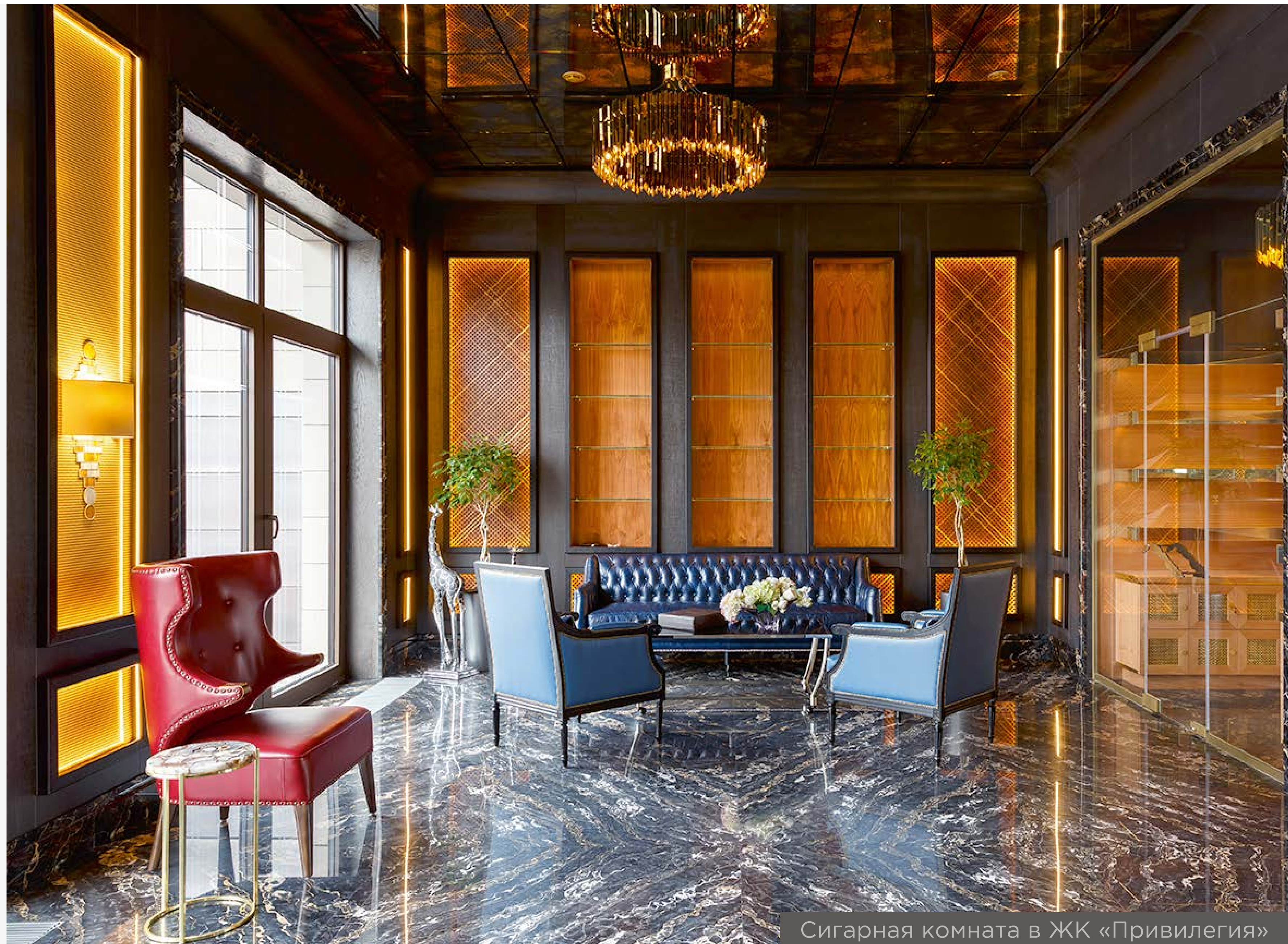
Сигарная комната в ЖК «Привилегия»