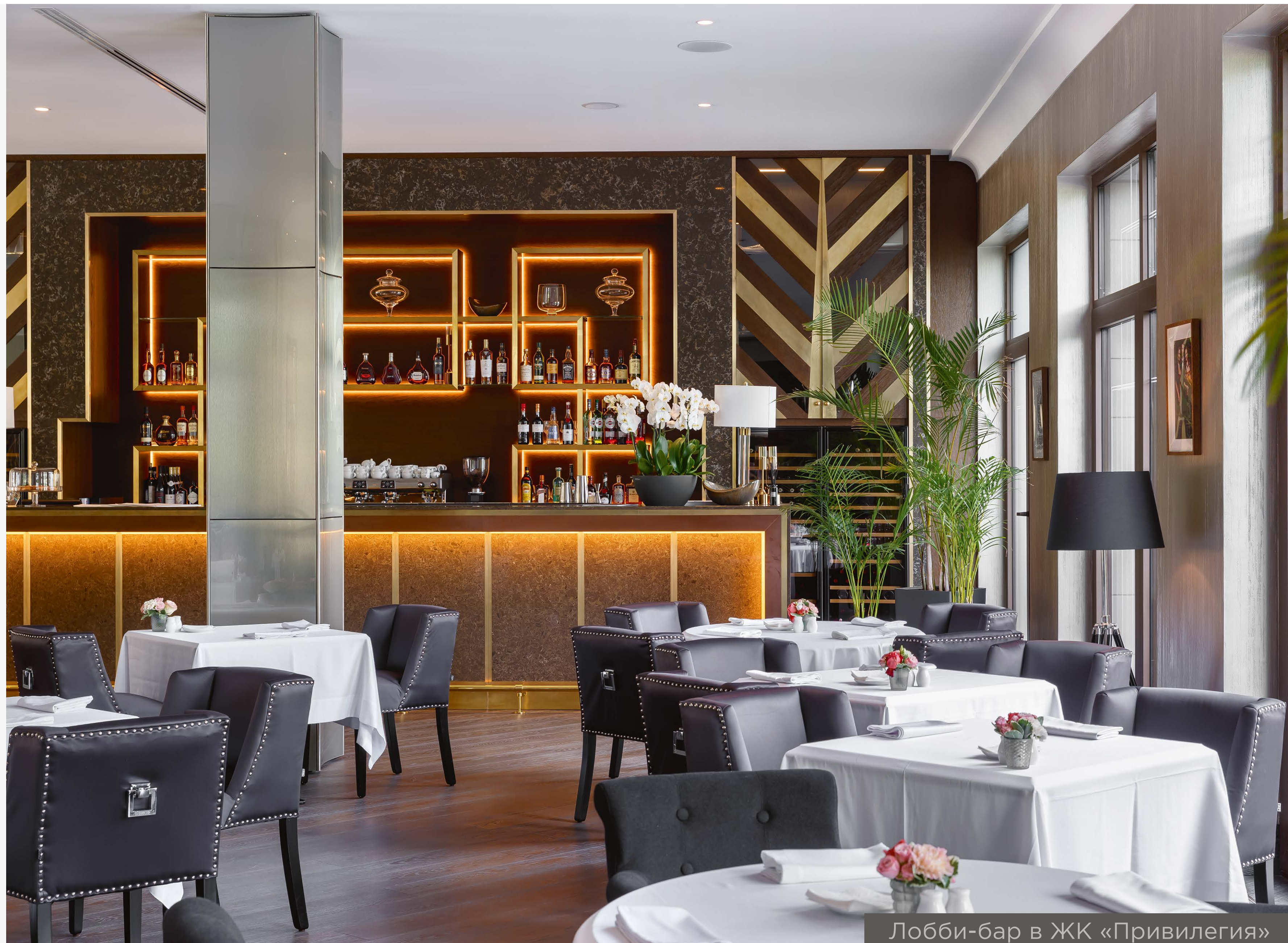
Лобби-бар в ЖК «Привилегия»