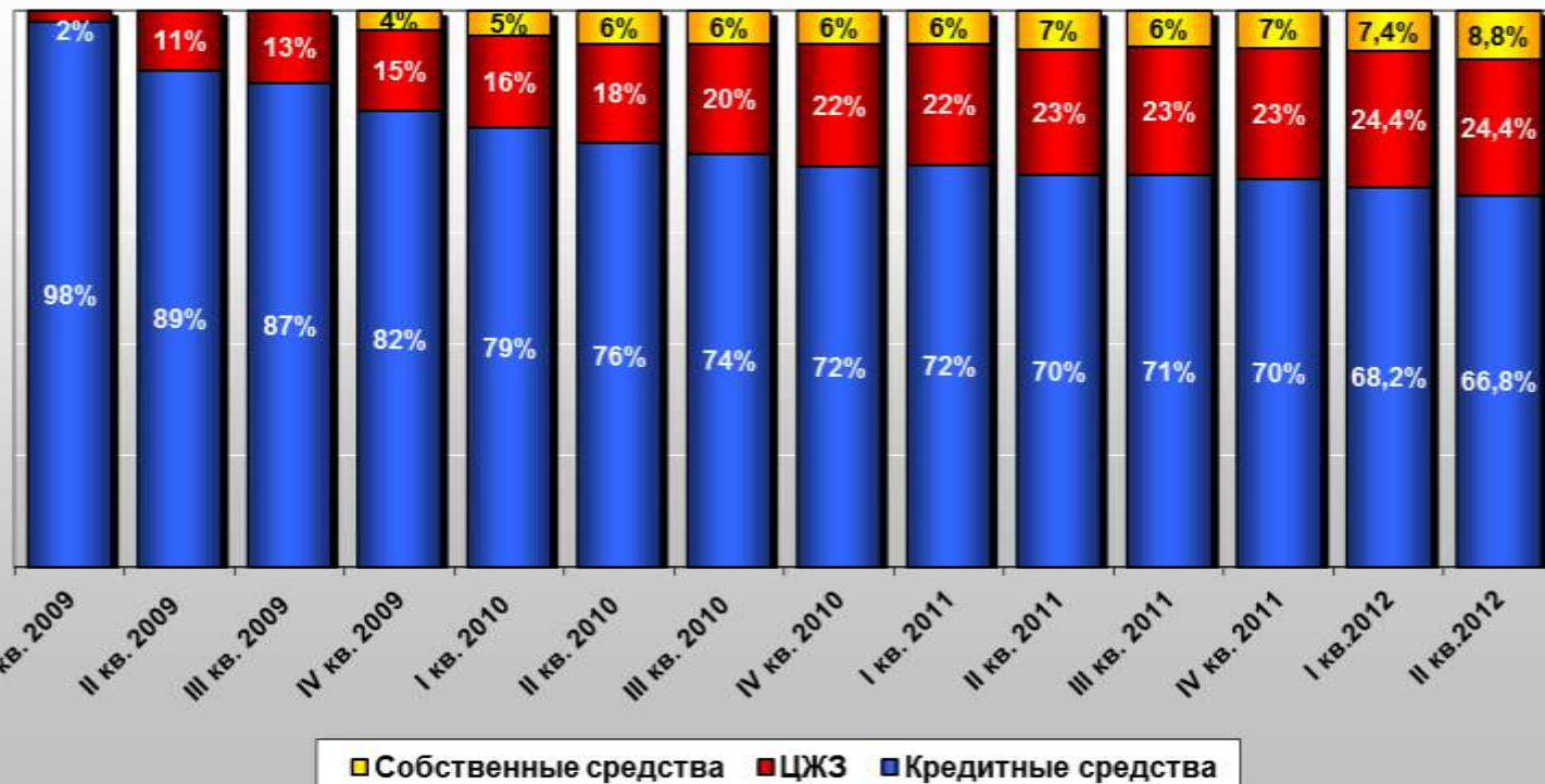
Структура сделок НИС по источникам финансирования